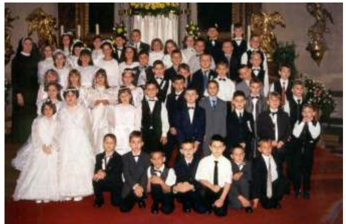
Vjeronau ne grupe sestre Augustine